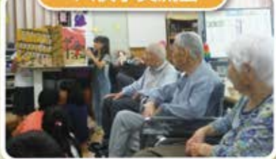
紙しばいを読んでもくれました