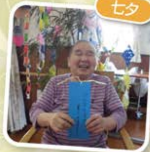
願いが 叶いますように…！