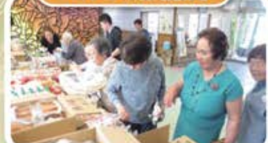
どれにしようか迷っちゃう〜