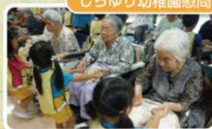
たくさん元気をもらいました!!