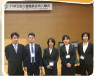
いばらき介護職員 合同入職式