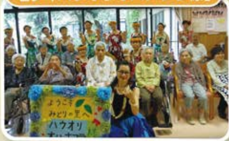
皆でフラダンスを踊りました♡