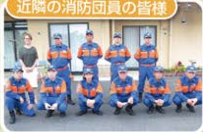
近隣の消防団員の皆様