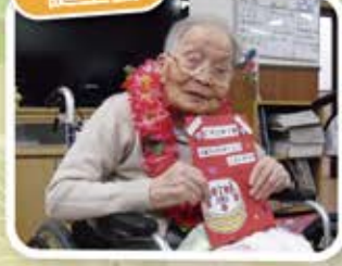
祝 103歳 おめでとうございます