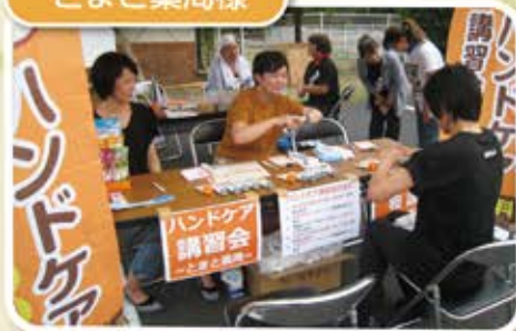
ハンドケア講習会とお薬相談を していただきました。