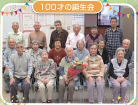
お誕生日おめでとう!!