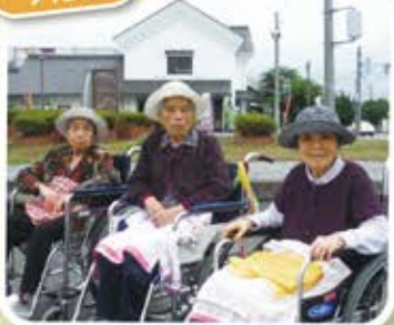
境の道の駅に行きました♪