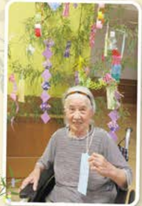
願い事 叶いますように〜♪