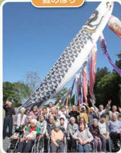
青空の下で元気いっぱい!