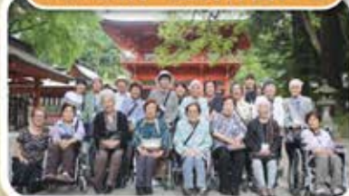
パワースポットで長寿祈願