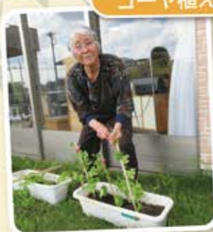
今年もゴーヤを植えました♪