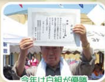
今年は白組が優勝