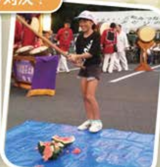
一生懸命頑張ってくれました