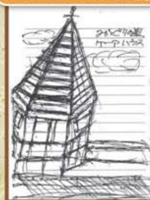
ケアハウスからの風景