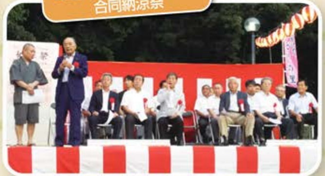
みどりの里・みどりの丘 合同納涼祭