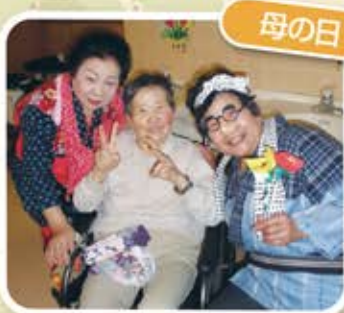
五ッ輪会様と一緒に！