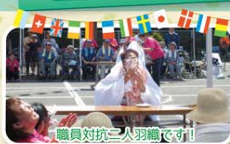
職員対抗二人羽織です!