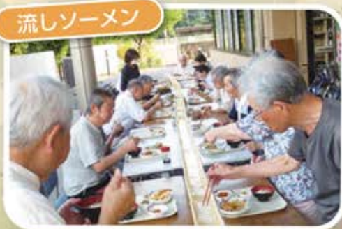
楽しく、おいしく、最高!!