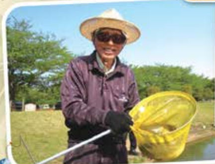
釣りを楽しみました!