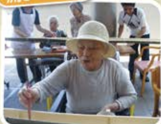
上手にとれるかしら？