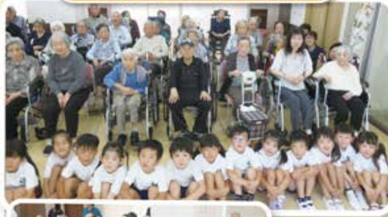
認定こども園三和 慰問