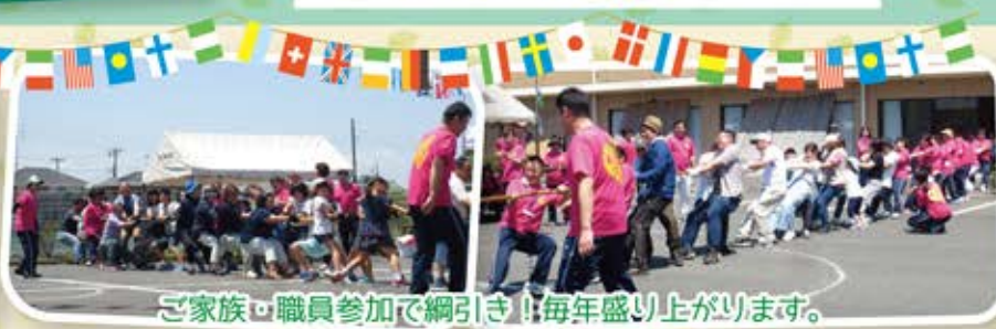
ご家族・職員参加で綱引き!毎年盛り上がります。