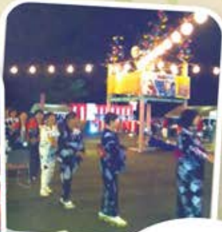
八俣ふきの芽会様