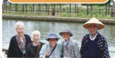
船頭さんと一緒に♪