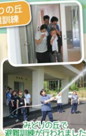
みどりの丘 避難訓練