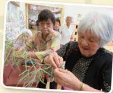
みなさんのお願い事は 何ですか??