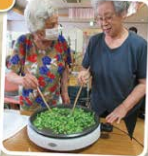
ゴーヤチャンプルを 作りました