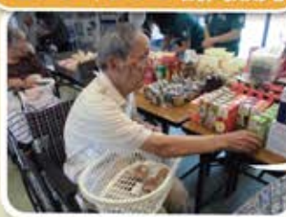
セブンイレブン訪問販売