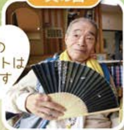
今年のプレゼントは扇子です