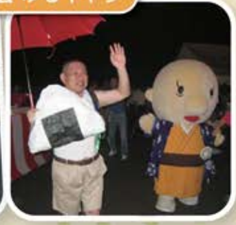
「ゆきとのくん」と仲良く一枚