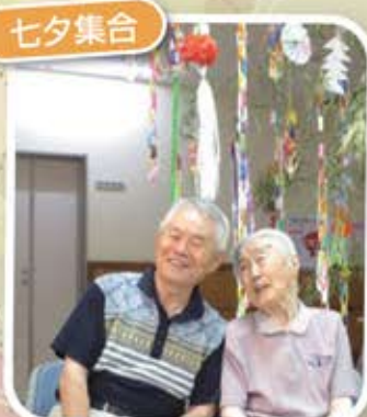
すてきなツージョット