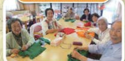
1人1人頑張って作りました