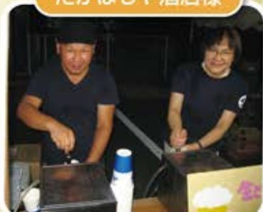
毎年おいしいビールを ありがとうございます。