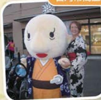
古河市商工会 ゆるキャラ