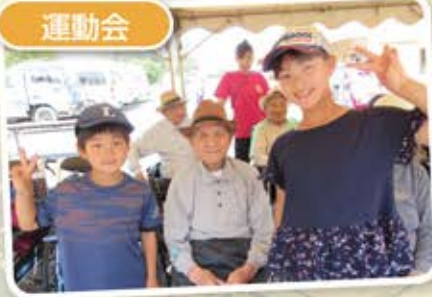
暑かったけど頑張りました!!