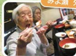
おいしいお寿司! ア〜ン♪