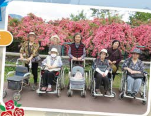
フラワーパークでバラ見学してきました! きれいでしたね♡