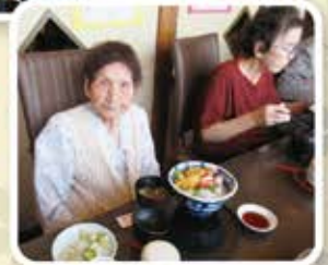
静の里での食事会 おいしかったです!