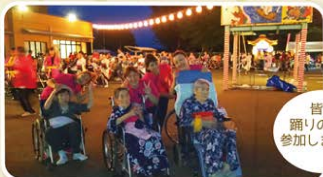
皆で 踊りの輪に 参加しました。