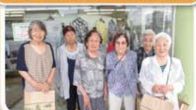
素敵な洋服を買ってきました