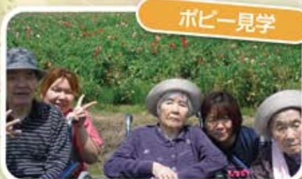
ポピー見ながらお弁当食べました♡