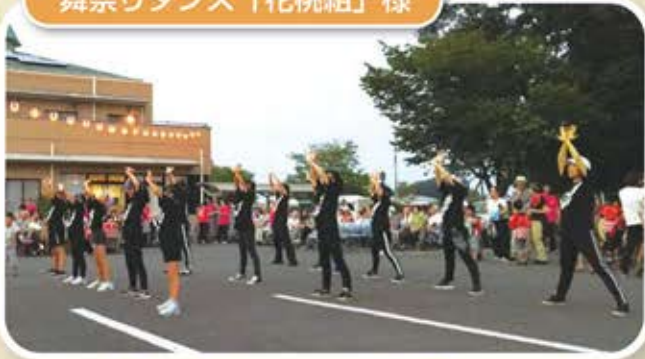
舞祭りダンス「花桃組」様