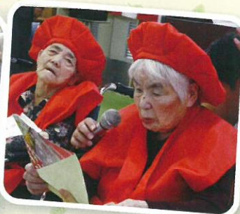
お礼のあいさつ、 少し緊張してます。