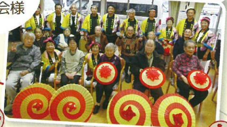
八木節・踊りよかったですね。