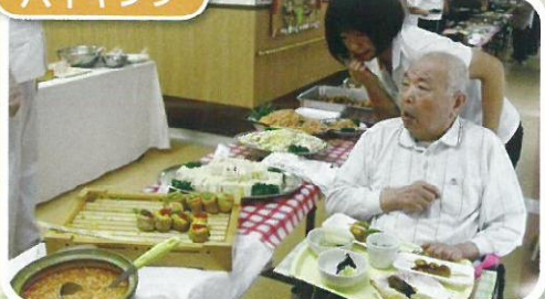
何を食べるか悩んじゃいますね