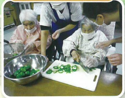
手作り昼食(八宝菜)