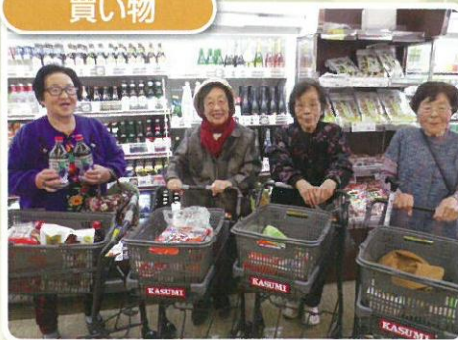
お買い物楽しかったですね！