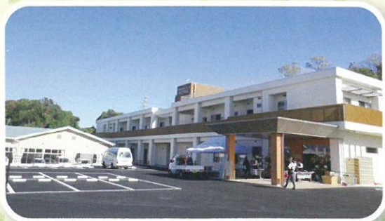
竣工式の日 晴天に恵まれました。