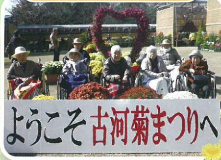
菊見(ネーブルパーク)