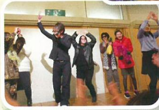
新人職員さんの余興