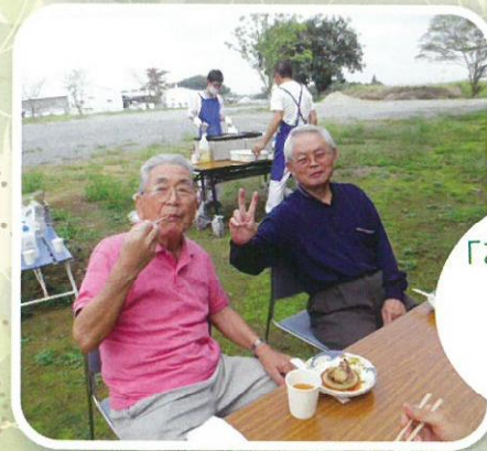
「みんなと一緒に 楽しさ一杯。 満腹！満腹！」