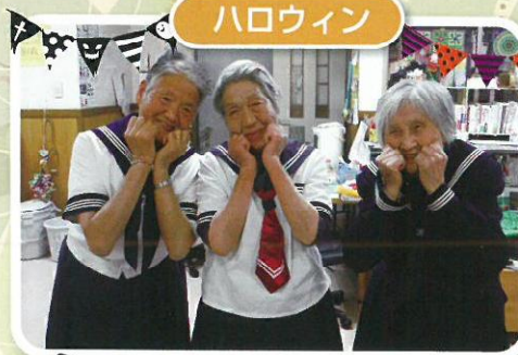
ハロウィンで学生時代に 戻りました。