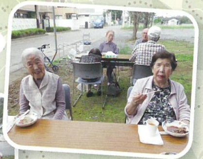
「子供の頃に行った 遠足を思い出すね。」