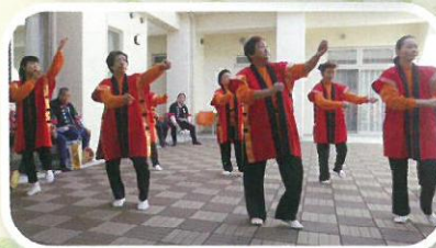
下尾崎第一 白寿会様