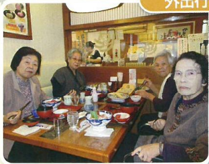
外食しながら、 関宿城に行って来ました。