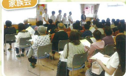
式典後、家族会もありました。