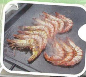
大きなエビに 笑顔がはじけます。