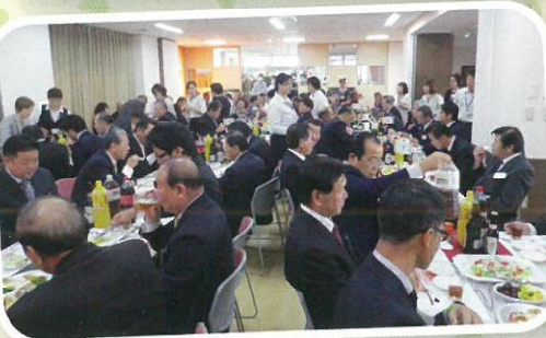
祝宴もとてもにぎやかでした。