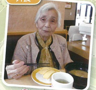
皆でお寿司を 食べに行きました。