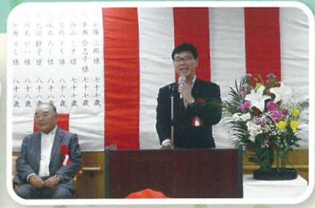
古河市長も お祝いに来てくれました。 ありがとうございました。