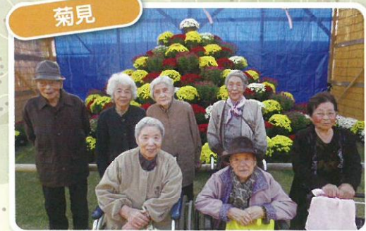
今年も菊がとてもキレイでした。