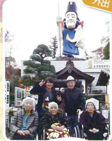
真岡市の 大前恵比寿神社に 行きました。 大きな恵比寿様に ビックリ!