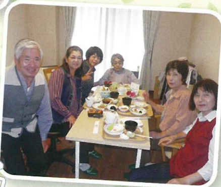
家族と食べるとさらにおいしい!