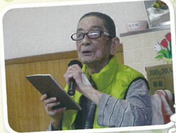
乾杯の発声 ありがとうございました。