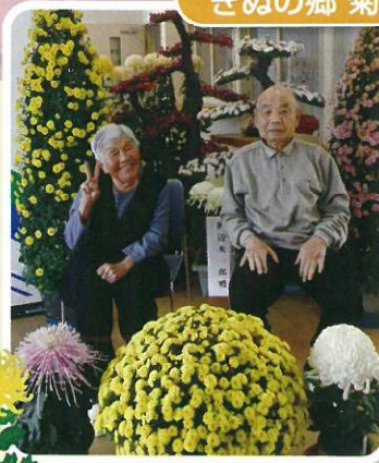
今年の菊も見事です。