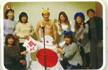
頑張って盛り上げます！ (親睦役員)