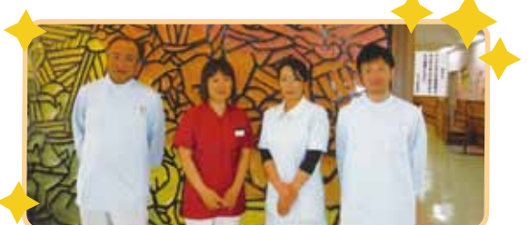
境クリニック/リハビリでお世話になっています。

桜や桃の花が咲く時期には、厨房特製のお弁当を持ってお花見です。暖かい陽気と美味しいお弁当、綺麗なお花で自然と笑顔がこぼれます。