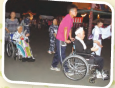
おじいちゃん、 おばあちゃんも 皆でいっしょに盆踊り！