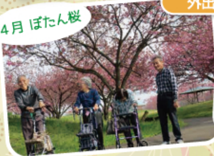
仲むつまじく 春らんまん