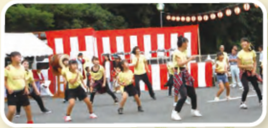
舞祭りダンス：花桃組の皆様 元気いっぱいありがとう。