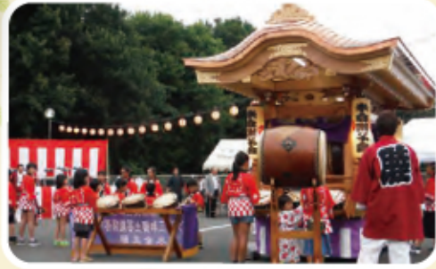
今年もありがとうございます。