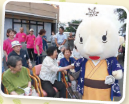
中に入っているのは だれでしょう？