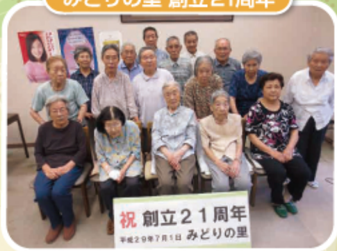
祝 創立21周年 平成29年7月1日 みどりの里