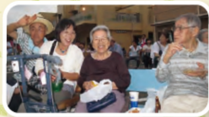
模擬店でおいしいもの たくさん買いました。