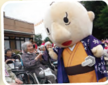
古河市商工会ゆるキャラ 「ゆきとくくん」 今年もありがとう！