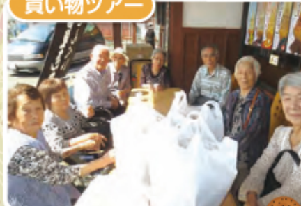
大人気、買い物ツアー、 本日は、おせんべい屋さん!