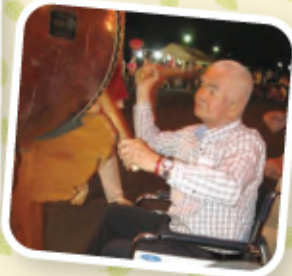
太鼓を叩く姿が とっても凛々しいです。