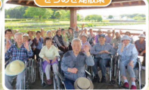
いい天气で気持ちいいですね。 ハイチーズ!