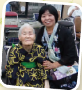
浴衣に着替えて ハイチーズ！