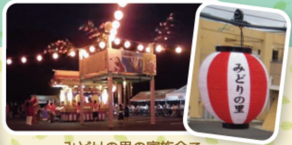
みどりの里の家族会で 購入していただいた提灯が とてもいい感じです！