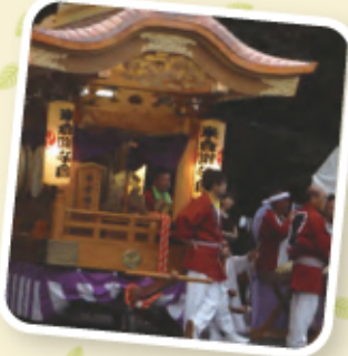
三和祇園囃子米倉支部様