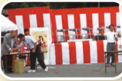
ロケット花火、点火！