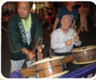
おじいちゃん 飛び入り参加！