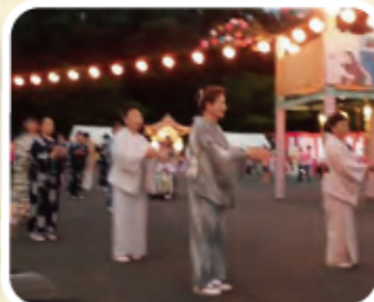
八俣ふきの芽会の皆様 ありがとうございます。