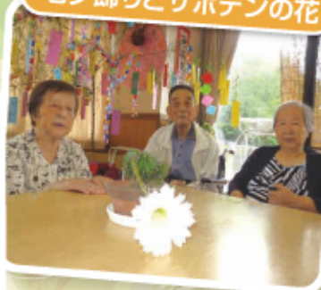
七夕飾りもサボテンの花も とってもきれいです。