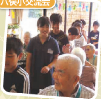
八俣小のお子さんと ハイタッチ! また来てね。