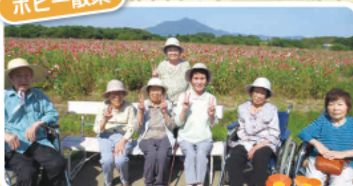
小貝川のポピーは、 今年も満開でした。