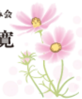
社会福祉法人 三和みつなみ会 理事長 並木 寛