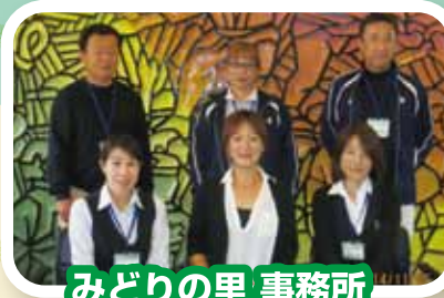
みどりの里 事務所