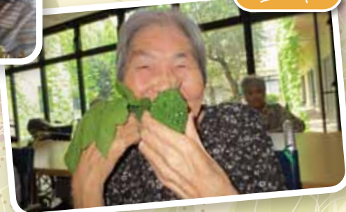
中庭のゴーヤがたくさん実りました。