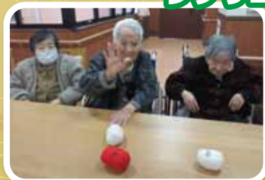
私をきれいにとってねー