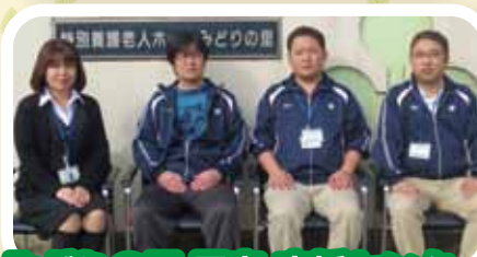
みどりの里 居宅・支援センター