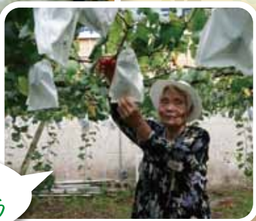
ぶどうの実 これが一番美味しそう