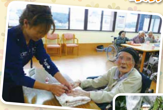
誕生日に手づくりケーキと ハンドマッサージ、ネイルを 行っています！！