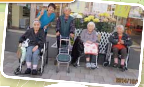
道の駅まくらがの郷