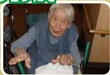
そば打ちのまねをする女そば打ち名人