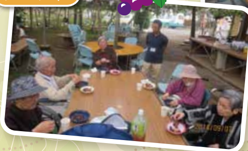
甘くてとても美味しかったです。

入居者の皆様のたくさん笑顔が見られるよう、職員一同これからも頑張っていきたいと思っております。