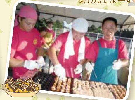
家族みんなでお祭り楽しんでま~す☆