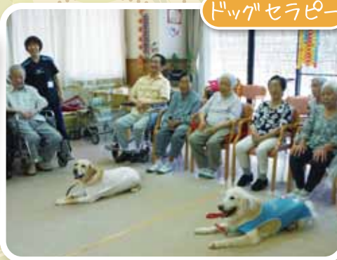
待て!! かしこいですねえ～