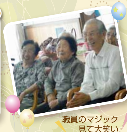
職員のマジック 見て大笑い!