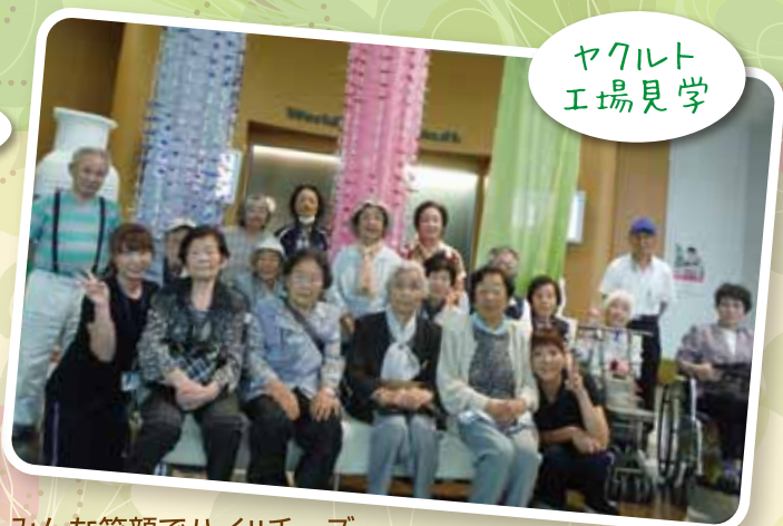
みんな笑顔でハイ!!チーズ