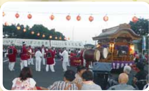
米倉お囃子会の皆様★