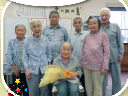
100歳の誕生日プレゼント