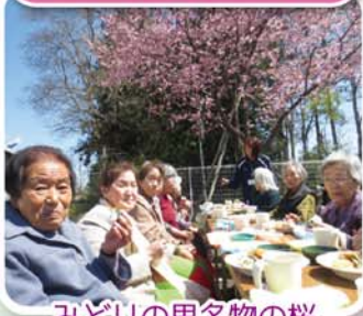
みどりの里名物の桜