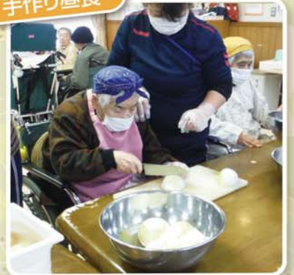
見事な包丁さばき！みんなでおいしいお昼ご飯を作ります。