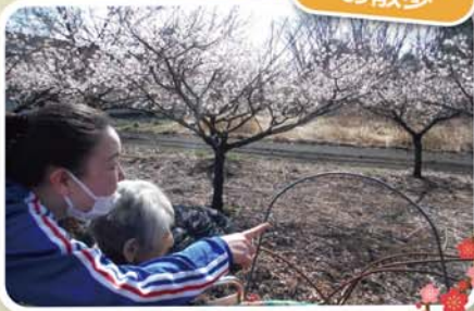
梅の花がキレイでした♪