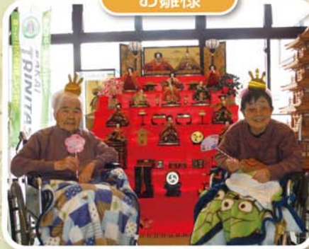
立派な雛壇の前で♪