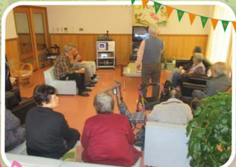
カラオケ大会盛り上がりました♪