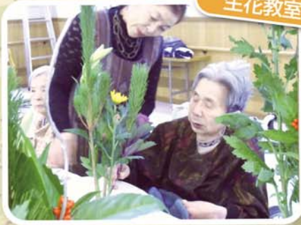
初挑戦のできればは？