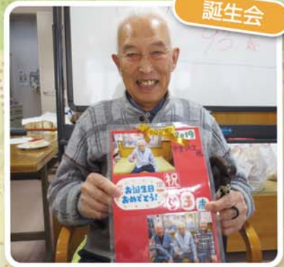
今年のプレゼントはコレ!