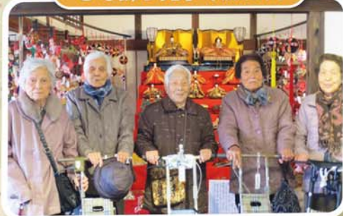
素敵かつるし雛でした♡