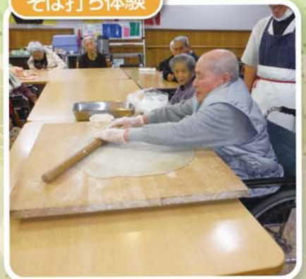
昔は良くやったもんだ！！