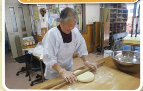
うどんなら任せて!!