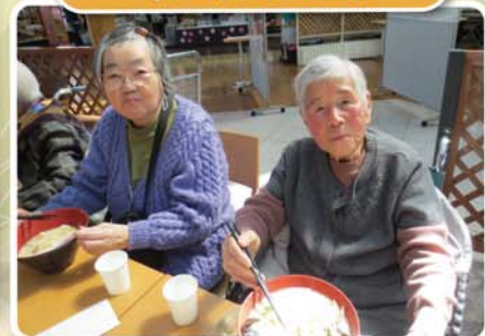
お腹いっぱい美味しかったね!