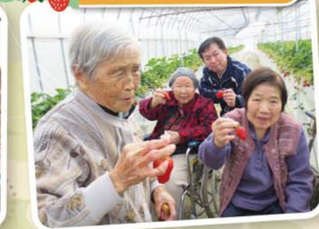
今年も甘〜いイチゴでした!