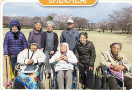
みんなで行ってきました。 楽しかったですね！