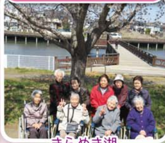
きらめき湖 (古河市)