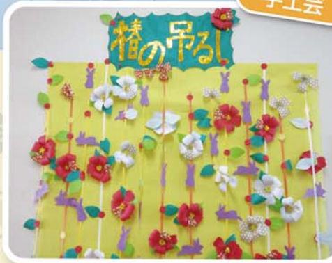
みんなで作りました！！