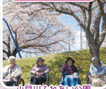
小貝川ふれあい公園 (下妻市)