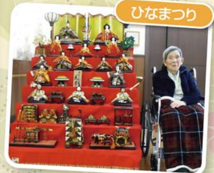
素敵なひな壇と一緒に！