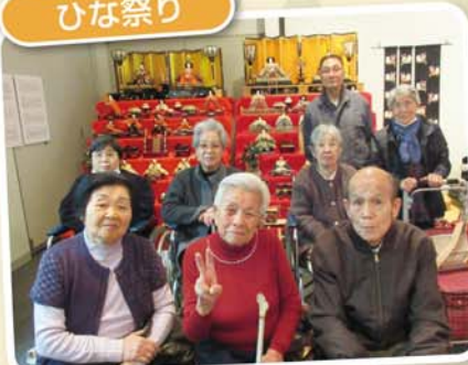
下妻へひな人形を見に行きました！