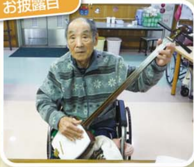
得意の三味線を披露してくれました♡