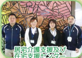
居宅介護支援及び在宅支援センター