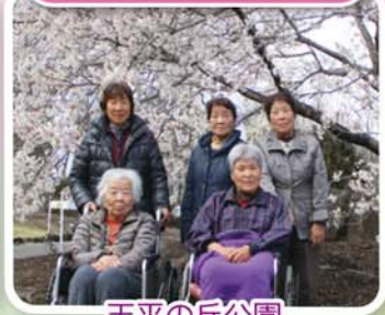
天平の丘公園 (下野市)