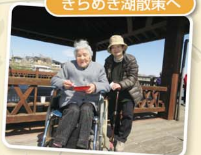
お弁当を持ってお花見へ♪ いつもみなさんに好評です。