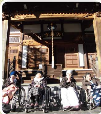
今年も良い年でありますように！