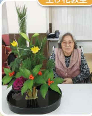
きれいに出来ました！