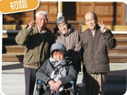
今年もよい一年でありますように…。