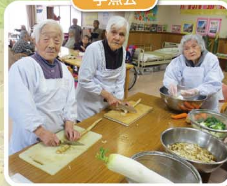
みんなで美味しくなあれ