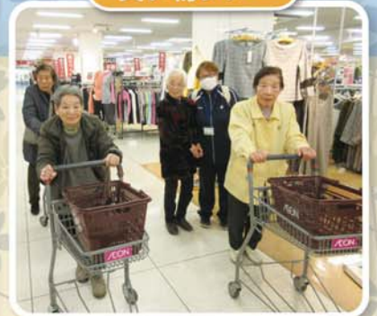
古河イオンに買い物☆ 何を買おうかな??