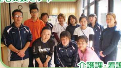
介護課・看護課 (本館)