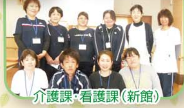
介護課・看護課 (新館)