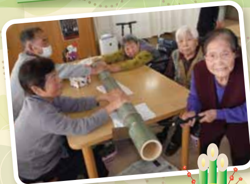
毎年恒例の門松づくりです。