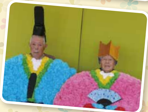
ご夫婦そろって、お内裏様とお雛様♡