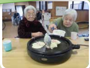
手作りおやつでお好み焼き