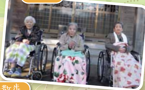
今年も幸せいっぱい の1年になりますように…。