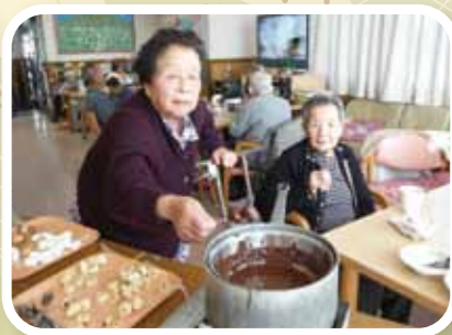
バレンタインにチョコフォンデュ