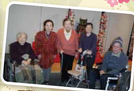
下妻に おひな様を見に行ってきました♪