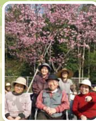
今年もきれいに咲きました