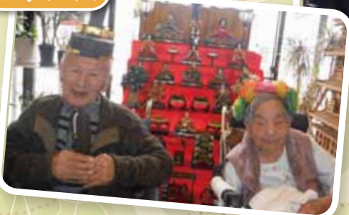
86歳のお内裏様と102歳のお雛様♡