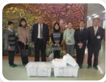
郵便局長会よりタオル