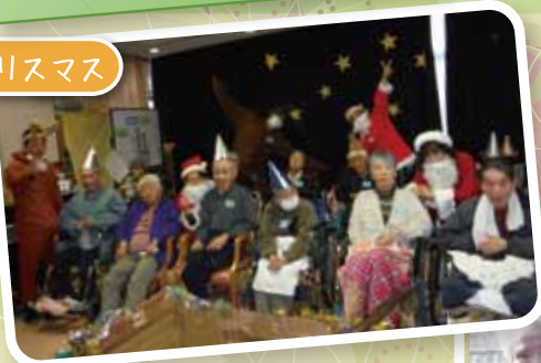
サンタさんにすてきな プレゼント！もらいました