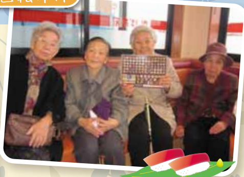
かっぱ寿司に行きました。初体験の回転寿司大好評でした♡