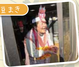
外にいる鬼に向かって「鬼は～外～」 「福は～内～」♪