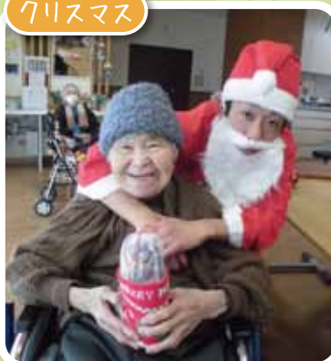
サンタさんと一緒に記念写真