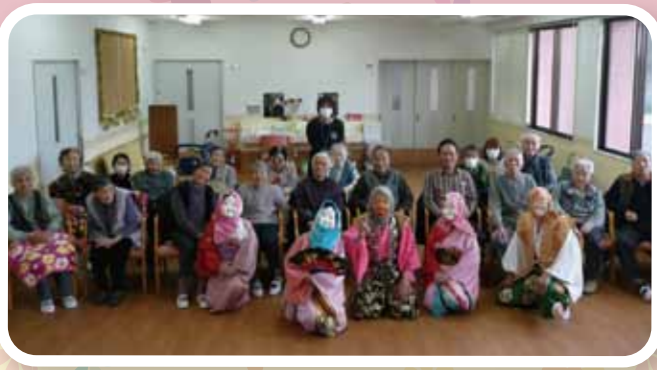
疑問 ひょっとこ愛好家の皆様と一緒に!!