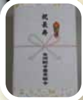
鮎甘露煮組合より 甘露煮とマスク