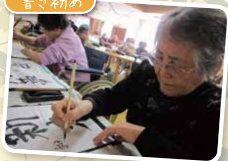
とても真剣な表情です。上手に書けましたか？！