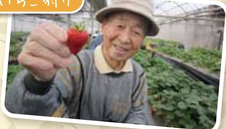
まっ赤ないちごを沢山食べて、この笑顔(^皿^) また来年も楽しみにしていま～す♡