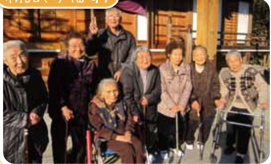
万福寺に初詣にいきました。皆で1年の健康をお祈りしました。